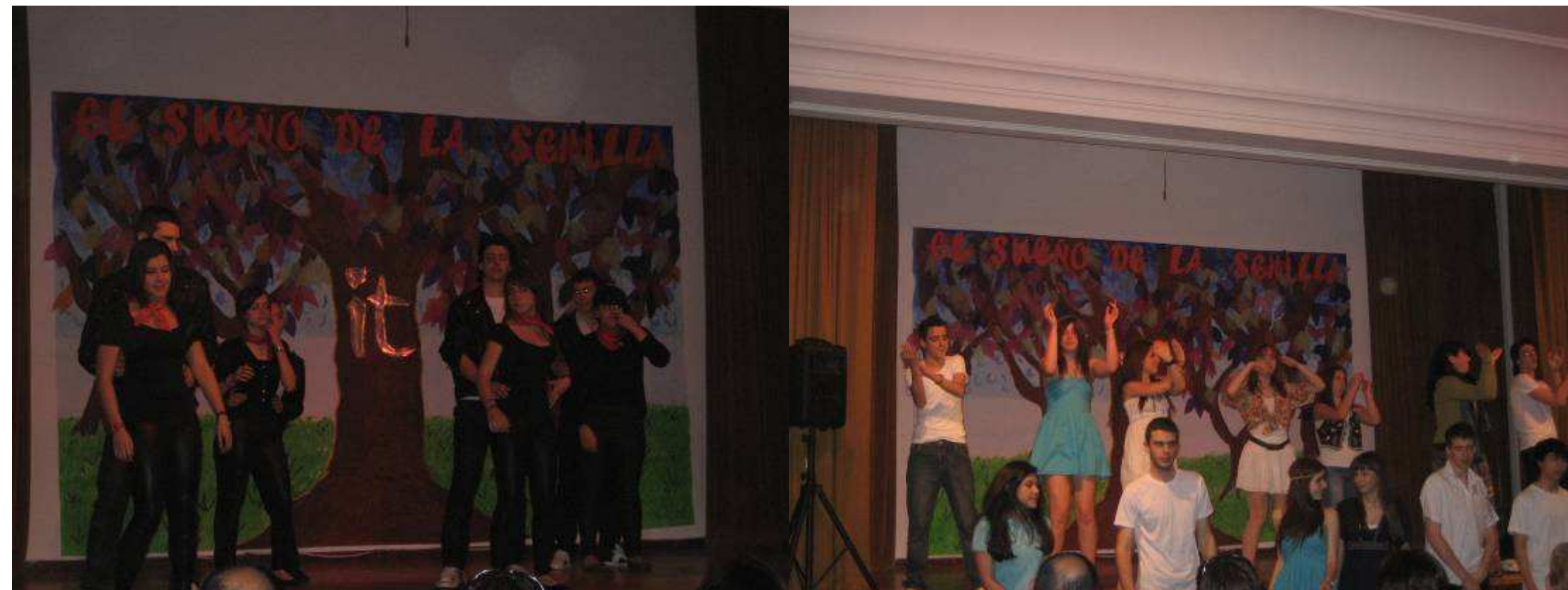
Mardi soir : Fête du Colegio qui célèbre les 100 ans de l'Institution thérésienne (i t) (association tutelle de l'établissement fondée par Pedro Poveda – prêtre et pédagogue)