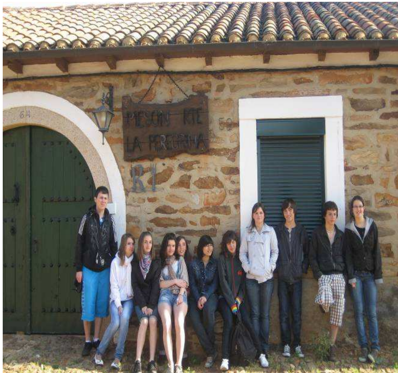
Mardi : avant la visite du « Museo del chocolate » à Astorga, visite d'un village pittoresque : Castrillo de los polvazares.